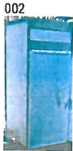
002 Kabine, abschließbar