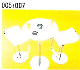
005+007 Stehtisch „Brio“ und Stehhocker „LEM“