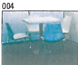
004 Sitzgruppe bestehend aus Tisch 80 x 80 cm weiß und 4 x Stuhl „MauI“ weiß