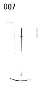
007 Stehhocker „LEM“